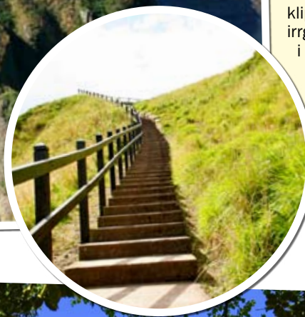
FRODIG: Den skotske naturen består av varmgule åkre og knallgrønne sletter.

Her går du for øvrig i fotsporene til Mel Gibson – slottet var nemlig kulissene til storfilmen «Hamlet». www.dunnotarcastle.co.uk