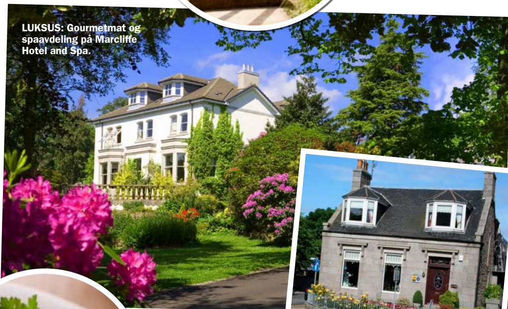
LUKSUS: Gourmetmat og spaavdeling på Marcliffe Hotel and Spa.

● Skene House Suites er en firestjerners hotellkjede med tre hoteller i sentrum. Romslike, komfortable studioleiligheter fra kr 1200 natten ( www.skene-house.co.uk ).