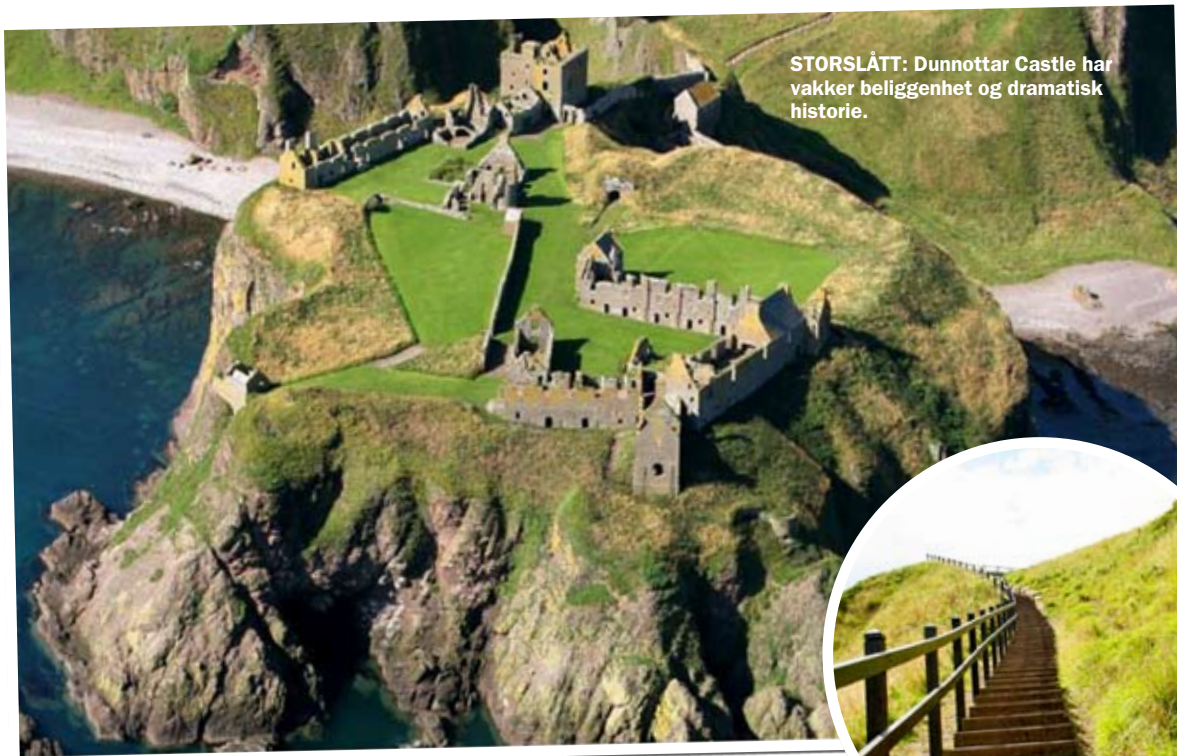
STORSLÅTT: Dunnotar Castle har vakker beliggenhet og dramatisk historie.