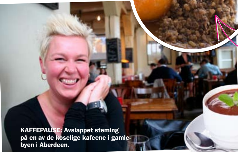
KAFFEPAUSE: Avslappet steming på en av de koselige kafeene i gamlebyen i Aberdeen.

delikatesser. Et yrende liv til lunsj, mens om kvelden er stemningen romantisk med levende lys og jazz ( www.cafebohomerestaurant.co.uk ). Cinnamon , en indisk restaurant på Union Street, har funnet en spennende miks mellom tradisjonell, indisk mat og moderne, europeisk haute cuisine. Hver rett har sin helt unike smak, og menyen skiftes hver måned. Servicen er upåklagelig ( www.aberdeen-restaurant.co.uk/cinnamon.htm ).