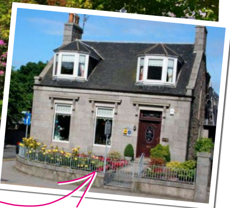
HJEMMEKOSELIG: Jays Guest House er et populært overnattingstilbud.